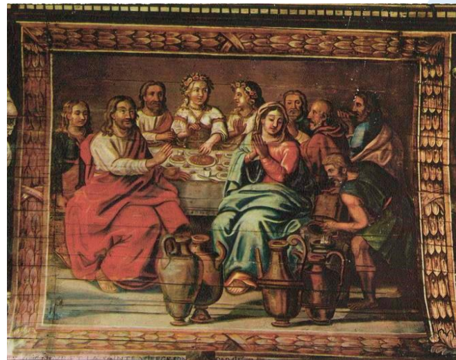
Plafond de l'église Saint-Cornély de Carnac (56)