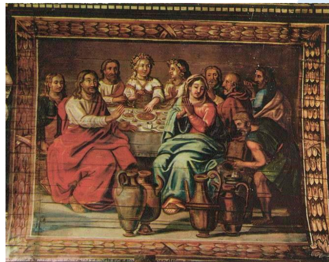
Plafond de l'église Saint-Cornély de Carnac (56)

Ce vin nouveau est le symbole du Christ. Grâce à Jésus, la fête continue. Il est notre espérance .